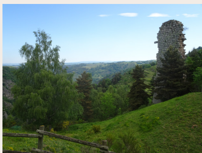
Vestiges de la tour d'Arzenc d'Apcher

Le folklore d'Arzenc d'Apcher est riche de deux légendes : «Lou roc de la Brouziduro», rocher hanté par le souvenir d'une jeune fille qui s'y tua pour échapper au fils du châtelain et «Lou Pas del Nobî» qui désigne un passage périlleux sur le Bès où un jeune marié se noya.