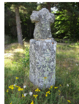
Croix de Claris

6 Contourner la [👁️ > grande croix de pierre] et emprunter en face un chemin qui passe sous l'abside du [👁️ > four bana]. 20 m plus loin, continuer à droite. A la fourche suivante, descendre à gauche. Au bas de la descente, virer sur un chemin à gauche. Couper la route D 53 (⚠️ > prudence ! ) et continuer tout droit. Traverser la Bédoule et monter à gauche. La piste devient goudronnée ; la suivre jusqu'aux premières maisons de La Fage-Montivernoux. Tourner deux fois à droite puis à gauche pour rejoindre le point de départ.