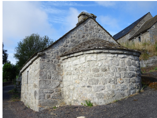
Four banal La Fage-Montivernoux