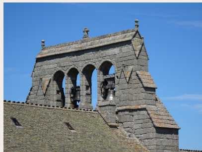
Église de La Fage-Montivernoux

à peigne, avec quatre baies, d'origine romane et, d'autre part, son portail gothique.