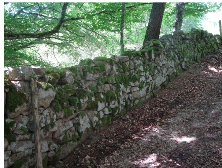
En descendant vers la Cruzeize