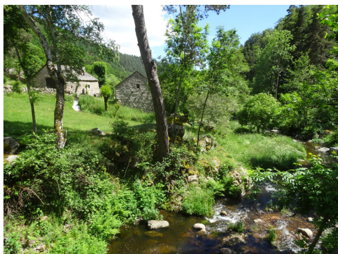
Andagnols et la Cruzeize