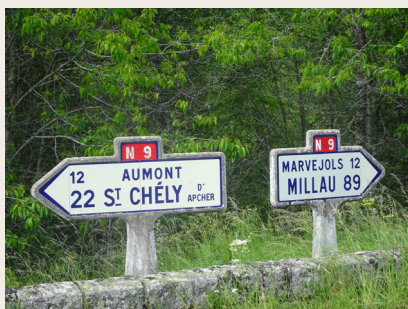
Anciens panneaux routiers N 9

1888 et seront marqués par la construction de nombreux viaducs (dont celui de l'Enfer) et tunnels (dont celui de Sainte-Lucie). L'arrivée du chemin de fer à Aumont lancera l'industrie du bois mais accélérera l'exode rural et déterminera la modification du nom du bourg qui deviendra Aumont-Aubrac en 1937, grâce à sa gare, la plus proche de l'Aubrac. La Route Impériale n°10 reliant Paris à l'Espagne via le Massif Central et Perpignan deviendra la RN 9. Celle-ci sera détrônée à partir de 1992 quand le 1er tronçon de l'autoroute A 75, dite "la Méridienne", déviera Aumont.